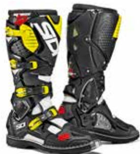
WHITE | BLACK | YELLOW FLUO BIANCO | NERO | GIALLO FLUO