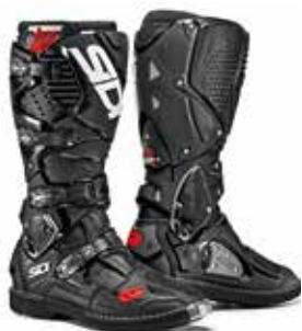
BLACK | BLACK