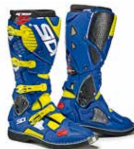
YELLOW FLUO | BLUE