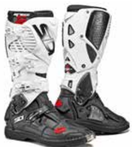
BLACK | WHITE NERO | BIANCO