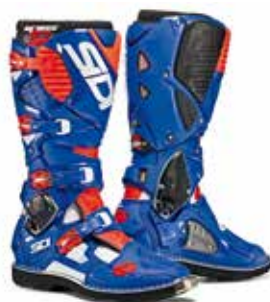
WHITE | BLUE | RED FLUO BIANCO | BLU | ROSSO FLUO