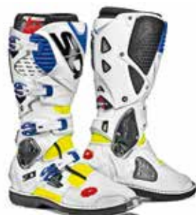
YELLOW FLUO | WHITE | BLUE GIALLO FLUO | BIANCO | BLU