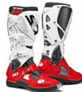
BLACK | RED | WHITE NERO | ROSSO | BIANCO