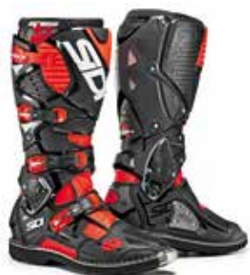
RED FLUO | BLACK ROSSO FLUO | BLACK