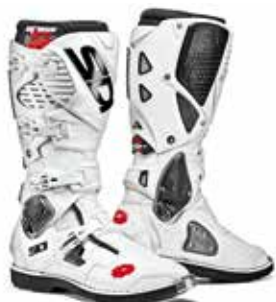
WHITE | WHITE