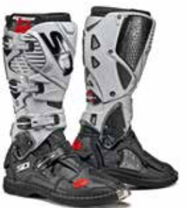
BLACK | ASH NERO | CENERE