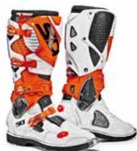
WHITE | ORANGE | BLACK